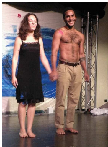
Comédiens du Collectif La Fabrique