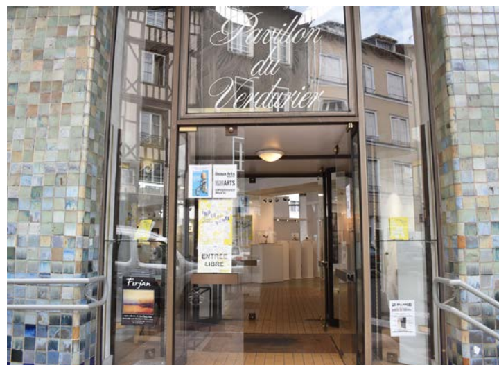
Le pavillon du Verdurier est un monument du centre-ville de Limoges, situé tout près du lycée Gay Lussac. Ancien pavillon frigorifique construit après la Première guerre mondiale, il est ensuite successivement un marché couvert, une gare routière puis, de nos jours encore, une salle d'exposition.

Plus d'informations au 06 88 95 36 66. L'ensemble de l'événement est gratuit.